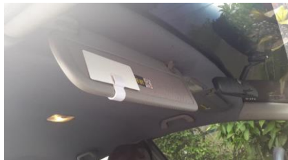
COLOCACION CORRECTA DE TARJETA VISERA DERECHA COPILOTO